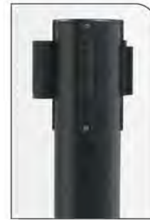
Aço pintado* Preto RAL 9005