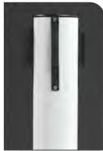
Aço pintado* Cinza RAL 7035

Pilares separadores metálicos, resistente e de grande estabilidade, para separação de áreas e guia pedonal.