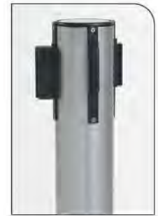
Aço pintado* Alumínio RAL 9006